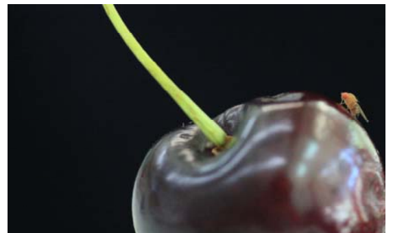
Weibchen auf Kirsche

2. Befallskontrolle: Regelmässige Befallskontrollen von mind. 50 Früchten pro Schlag helfen beim frühzeitigen erkennen des Befalls, so dass Ernte- und Pflanzenschutzmanagement sofort angepasst, die Hygienemassnahmen intensiviert und der Erntetermin vorgezogen werden kann. Befallsproben auf Eiablagen und Einstichlöcher kontrollieren und/oder 2h in lauwarmes Salzwasser geben und danach auf Maden kontrollieren.