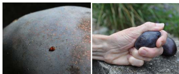
Eiablagen auf Zwetschge und Saftaustritt bei leichtem Druck