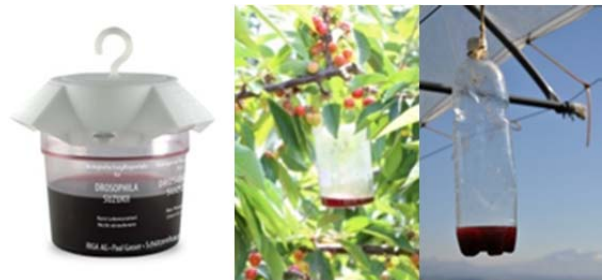
Überwachung: Becherfalle, Agroscope Falle, PET-Falle mit 3 mm Löchern

Die Kirschessigfliege (KEF) hat 2014 im Feldobstbau bei Kirschen und Zwetschgen massive Fruchtschäden verursacht. Im Grosserntejahr platzten viele Brenn- und Konservenkirschen witterungsbedingt im Juli auf. Viele Früchte wurden zu spät oder gar nicht geerntet, was die Massenvermehrung der KEF förderte. Um dies im Feldobstbau künftig zu vermeiden werden nachfolgend die wichtigsten Schutzmassnahmen und flankierenden Massnahmen dargestellt. Ziel: Populationsaufbau der KEF schon früh im Jahr verhindern und keine Vermehrungsmöglichkeiten schaffen. Nicht abgeerntete Bäume sind Brutstätten und gefährden später heranreifende, benachbarte Bäume und Kulturen. Die Verantwortung sowie die Umsetzung von Hygienemassnahmen und des Erntemanagement liegen bei den Produzenten.