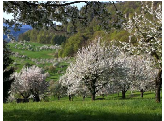
Feldobstbestände sind hochattraktiv für KEF

1. Überwachung: Zur Früherkennung der KEF sind auch Feldobstbäume am Rand und im angrenzenden Umland (natürliche Habitats wie Hecken usw.) mit mehreren Becherfallen oder vergleichbaren Modellen zu überwachen und wöchentlich auf Präsenz der Fliege zu kontrollieren. Bei Fängen ist mit Fruchtschäden zu rechnen. Flüssigkeit absieben, gefangene Insekten in weisses Gefäss klopfen und mit Wasser verdünnen. Männchen anhand der Merkmale bestimmen und zählen. Fänge können auch auf www.drosophilasuzukii.agroscope.ch verglichen werden.