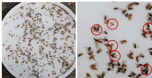
Einfache Bestimmung von Männchen